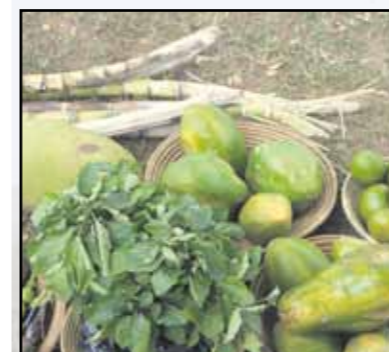
Papája a iné v Ugande bežné ovocie prejde na ceste na náš stôl tisíce kilometrov.

Pláca pre zamestnancov tvorí iba dve až tri percentá z ceny laptopu. Na jednom počítači a jeho komponentoch pracuje priemerne 58 subdodávateľských závodov.