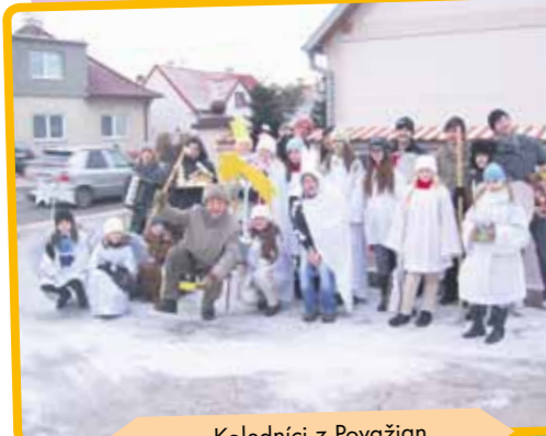
Koledníci z Považian