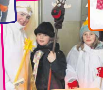
Koledníci z Nového Mesta n. Váhom

Prvý raz sme koledovali aj po niektorých svätých omšiach pred kostolom. Ľudia sa tomu veľmi potešili, lebo všetci nemohli prijať koledníkov do svojho prístrešku. No potešení boli aj tí tradiční, ku ktorým chodievame už viac rokov, či novoprihlásení. Najväčšiu radosť však mali asi babičky v domove dôchodcov.