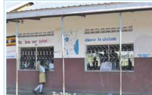
Nové triedy Základnej školy sv. Cypriána postavené z prostriedkov Dobrej noviny