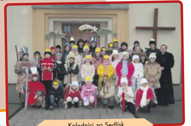
Koledníci zo Sedlísk

Koledovanie Dobrej noviny sa v našej farnosti uskutočnilo prvý raz. Deti sa do tejto akcie hlásili s nadšením. Koledovali s radosťou a ohlasy boli pozitívne. Najstarší koledník mal 30 rokov a najmladší štyri. Sme radi, že sme mohli pomôcť. Bohu vďaka za tento projekt a za všetkých, ktorí sa akýmkoľvek spôsobom zapojili do tejto akcie.