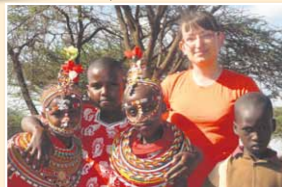
Lucia počas návštevy na vzdialenej misii s deťmi z kmeňa Samburu

KOORDINÁTORKA DOBROVOĽNÍCKEHO PROJEKTU