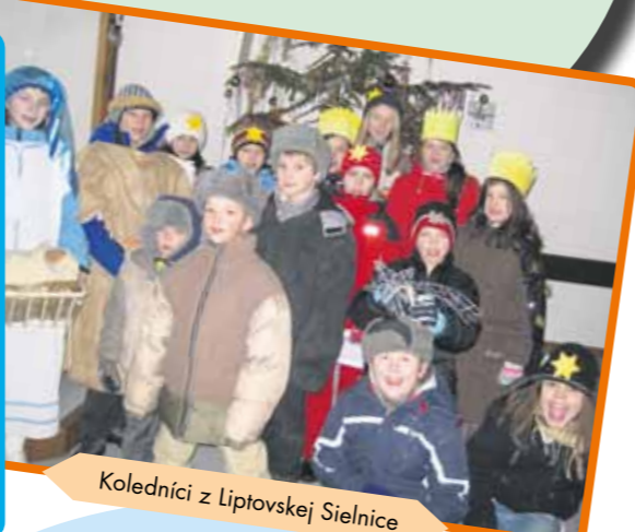
Koledníci z Liptovskej Sielnic

Aj tento rok sme koncom novembra rozbehli Dobrú novinu. Pocivo sme sa pripravovali na strečkách, rozprávali sa o environmentálnej téme, spievali koledy a cvičili vinše. Dobré prípravení sme sa s pozhnaním o Štefana vybrali ohlásiť Dobrú novinu do našich domácností. V každom dome nás milo privítali. Domáci si vypočuli naše pripravené vinše a koledy, finančne podporili projekty DN, ponúkli nás zákuskami, ovocím a čajom. Tešili sme sa aj z toho, že počas koledovania nám sneh pekne zdobil cestu a pofukoval vetriček. Christos raždajetsja!