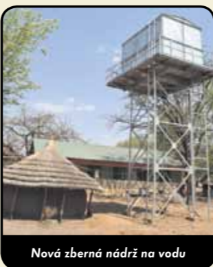
Nová zberná nádrž na vodu