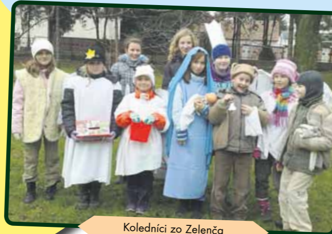
Koledníci zo Zelenča

S Dobrou novinou sme koledovali už šiesty rok. Človek by si myslel, že nás to omrzí, no opak je pravdou. Deti sa snažia z roka na rok čoraz viac. Vôbec im neprekáža, že vonku mrznú, obehnú celú farnosť, nevidia rozprávky v televízii. Teší ich, že svojou obetou pomôžu druhým ľuďom, ktorí to potrebujú. Sme na naše decká hrdí.