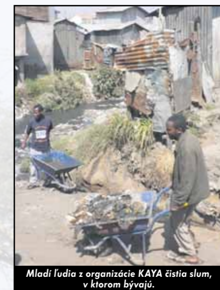
Mladí ľudia z organizácie KAYA čistia slum, v ktorom bývajú.

Pri odhadovanej priemernej cene 0,5 EUR za liter vychádza, že sme na ňu minulí 195,75 miliónov eur, čo je takmer šesť miliárd korún. Ak bol vo fľaši zabalený priemerne liter vody, znamená to 391 500 000 plastových fľaš – a to je celkom slušná kopa odpadu.