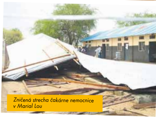
Zničená strecha čakárne nemocnice v Marial Lou