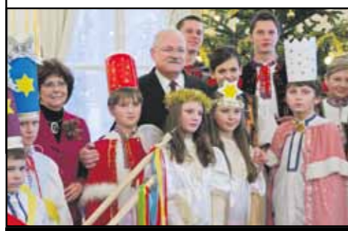
Koledníci Dobrej noviny u prezidenta SR