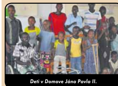
Deti v Domove Jána Pavla II.