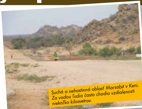
Suchá a nehostinná oblasť Marsabit v Keni. Za vodou ľudia často chodia vzdialenosť niekoľko kilometrov.