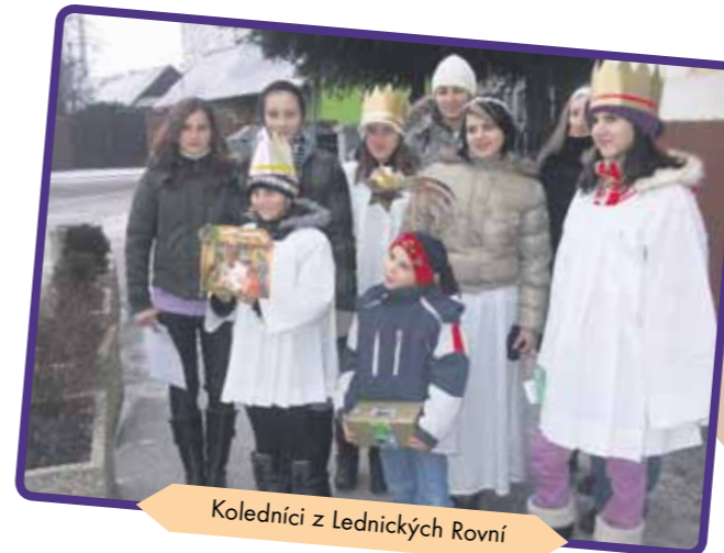
Koledníci z Lednických Rovní