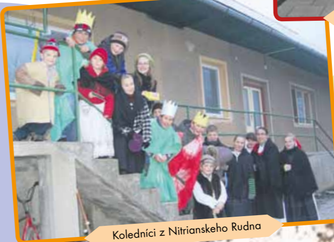
Koledníci z Nitrianskeho Rudna

Keďže koledujeme už šestnásť rok, ľudia u nás koledovanie dobre poznajú. Sú veľmi otvorení na potreby druhých a ochotne pomáhajú. Deti sa tento rok zapojilo tiež pomerne veľa. Prišlo nám aj počasie, takže všetko bolo super. Na druhý deň sme boli odniesť vykoledované ovocie a cukríky deťom v Krízovom stredisku v Kežmarku a tiež sme boli zakoledovať našim kňazom na fare.