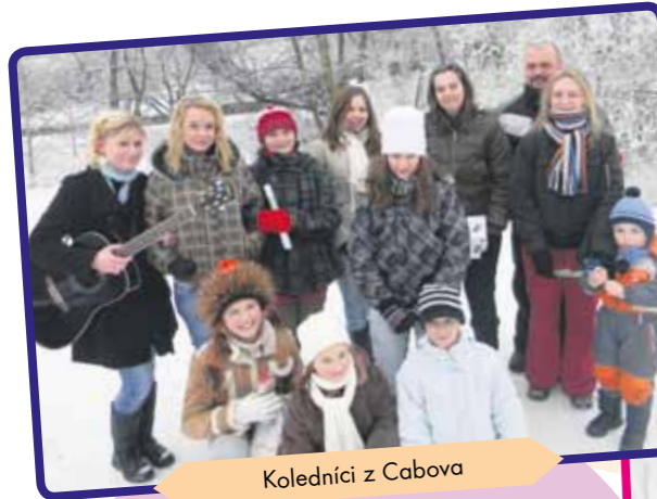
Koledníci z Cabova

Tento rok sme prvý raz pripravili program v nárečí a ľuďom sa to veľmi páčilo. Deti mali trochu viac starostí s učením sa textov, no zvládli to.