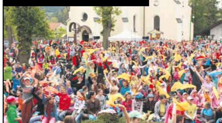
Radostná atmosféra v Rajeckej Lesnej