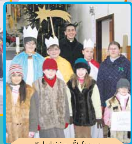
Koledníci zo Štefanova