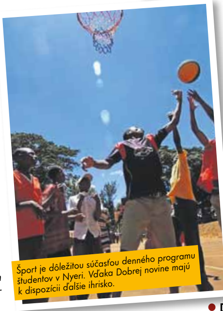
Šport je dôležitou súčasťou denného programu študentov v Nyeri. Vďaka Dobrej novine majú k dispozícii ďalšie ihrisko.