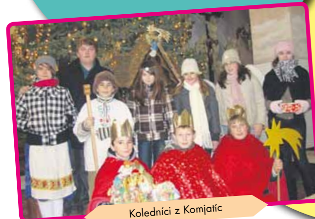
Koledníci z Komjatíc