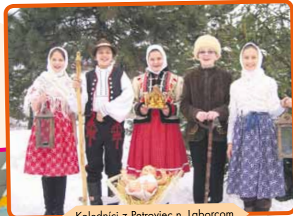
Koledníci z Petrovca n. Laborcom

Deti, ktoré sa zapojili do Dobrej noviny, mali zo samotného koledovania radosť a aj ich rodičia sa nám pochválili, že vďaka Dobrej novine u nich vládla vianočná nálada už od novembra. Sme vďační, že sme sa do koledovania zapojili aj tento rok a dúfame, že budúci rok budeme v tejto nádhernej zvesti pokračovať.