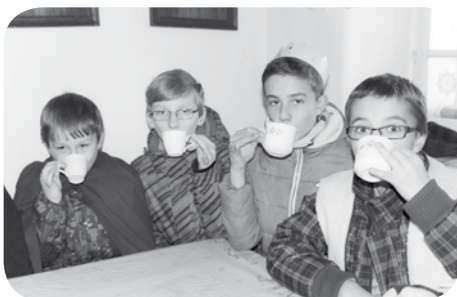
Foto: Traja králi s pastierom v Bošáci, 2015

Neváhajte a pridajte sa aj tento rok k ohlasovateľom Radostnej zvesti!