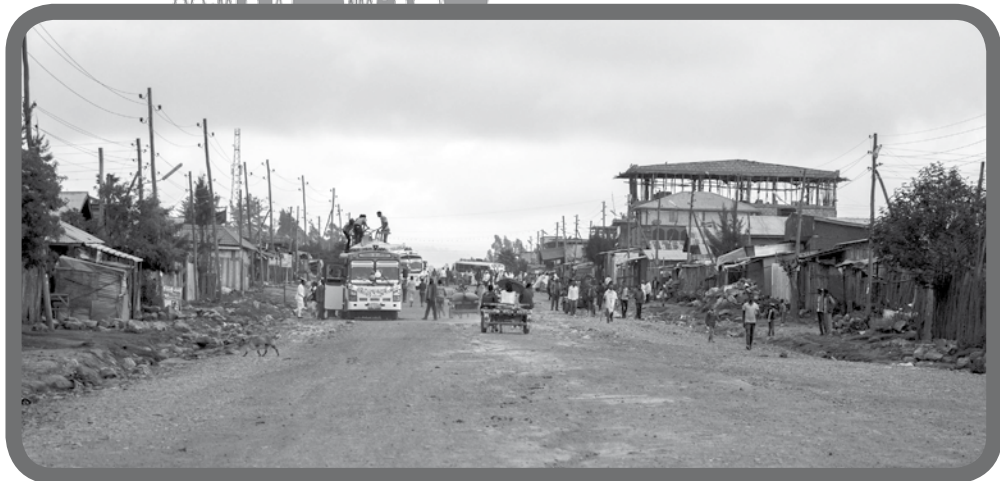
Ruch na hlavnej ulíci v meste Karsa, Etiópia, 2016, foto: Danica Olexová

INformačník DOBREJ NOVINY vydáva eRko - HKSD pre vnútornú potrebu. Kontakt: eRko - HKSD, Miletičova 7, 821 08 Bratislava 2; www.dobranovina.sk e-mail: dn@erko.sk ; Tel.: 02 20 44 52 54; mobil: 0908 183 410; Zodpovedná redaktorka: Mgr. Anna Paľovová. Neprešlo jazykovou úpravou.