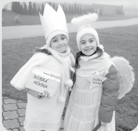
Foto: Koledníčky z Biňoviec, 2015