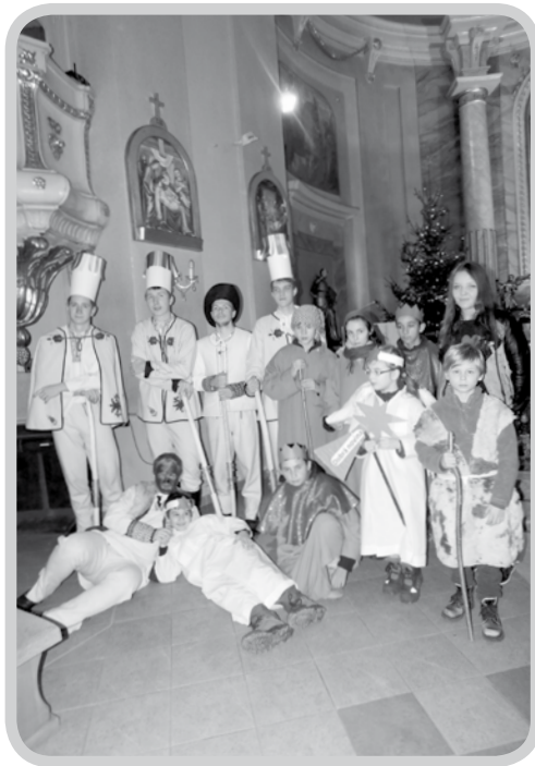
Foto: Koledníci z Brezna, 2016

Osobné prevzatie propagačných materiálov nám veľmi uľahčí distribúciu a pomôže nám pri plánovaní vysielacích sv. omší. Prihlasovanie vopred nie je potrebné, cestovné náklady vám preplatíme.