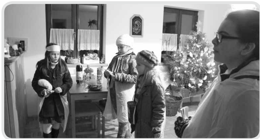
Foto: Koledníci z Bošáče, 2015

Kurz je výborná príležitosť spoznať Dobrú novinu a dozvedieť sa viac...