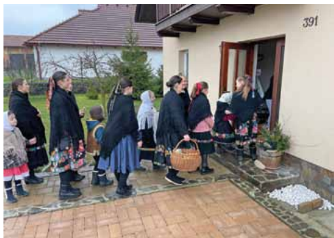
Koledníci z Korytárok. Dobrá novina, 2023.

Zapojte sa do koledovania opäť naplno a tradične OD DOMU K DOMU resp. navštívením prihlásených rodín! Koledovanie v rodinách má jedinečný charakter ohlasovania evanjelia, radostnej zvesti všetkým ľuďom dobrej vôle, ktoré sa prvýkrát udialo, keď sa anjel zjavil betlehemským pastierom.