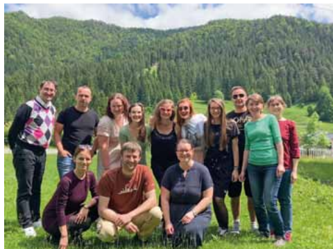
Stretnutie Komisie Dobrej noviny v Liptovských Revúciach. Dobrá novina, 2023.

Na jar 2024 budú prebiehať voľby do Komisie Dobrej noviny. Kandidovať môže každý kto má 20 rokov, je členom eRka (aj budúcim) a zúčastnil sa aktivít Dobrej noviny aspoň v dvoch ročníkoch. Viac informácií dostanete emailom po novom roku. Ak by vás zaujímalo, aké úlohy majú komisári Dobrej noviny nájdete ich v príručke pre zodpovedné osoby.