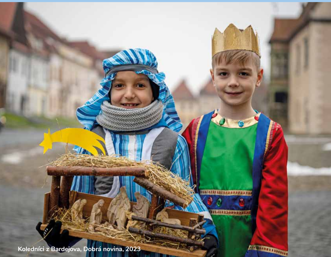
Koledníci z Bardejova, Dobrá novina, 2023