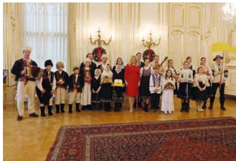
Koledníci z Kátloviec z Trnavskej arcidiecézy a Podkoníc z Banskobystrickej diecézy v Prezidentskom paláci. Dobrá novina, 2023.

Aj v 29. ročníku zaznie Dobrá novina v Prezidentskom paláci. Všetkých koledníkov budú reprezentovať skupinky z Bratislavskej arcidiecézy, Žilinskej diecézy a Prešovskej archieparchie, ktoré prezidentke Zuzane Čaputovej prinesú radostnú zvesť. Našich koledníkov takisto prijme počas Vianoc apoštolský nuncius na Slovensku, Mons. Nicola Girasoli.