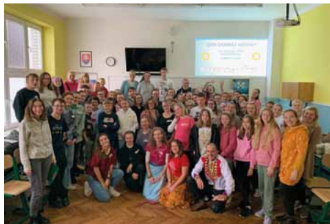
Deň Dobrej noviny v Ružomberku. Dobrá novina, 2023

Advent je vždy časom duchovnej i praktickej prípravy na Vianoce. Povzbudzujeme vás, aby ste sa spolu s koledníkmi pripravili na Vianoce formou koledníckych stretnutí. Určite využijete najnovšie Metodické materiály s množstvom zaujímavých námetov a aktivít a tiež podrobný manuál Ako robiť kolednícke stretká . Advent môžu malí koledníci prežiť spolu s adventným kalendárom HVIEZDY NAD BETLEHEMOM a posledné dni pred Vianocami môžete spolu putovať a hľadať prístrešie pre Svätú rodinu prostredníctvom modlitby deviatnika Kto dá prístrešie Svätej rodine? Ak by ste potrebovali viac kusov materiálov, ozvite sa, prosím, na dn@erko.sk . Nájdete ich aj na našej stránke v časti Koledovanie/Methodika a inšpirácie .