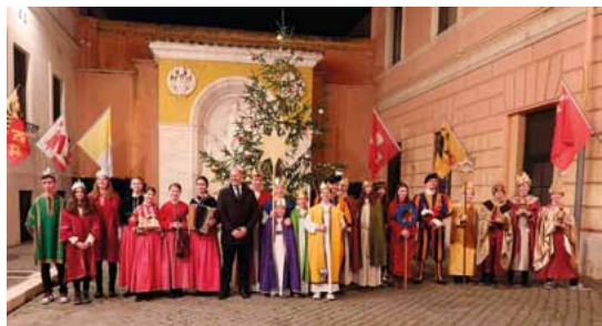
Koledníčky z Liptovských Sliačov zakoledovali vo Vatikáne aj Švajčiarskej garde. Dobrá novina, 2022.

Detailné informácie nájdete na na webe Dobrej noviny .