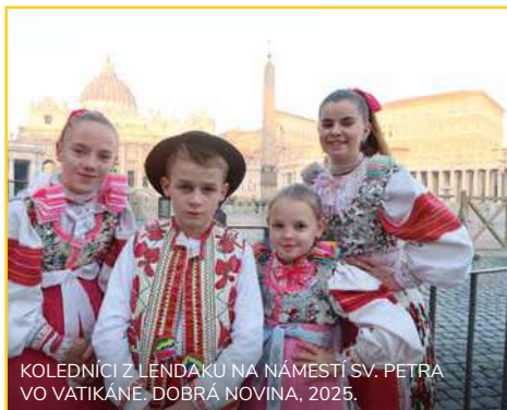
KOLEDNÍCI Z LENDAKU NA NÁMESTÍ SV. PETRA VO VATIKÁNE, DOBRÁ NOVINA, 2025.

Na prelome rokov 2025 a 2026 bude v Ríme a Vatikáne reprezentovať Dobrú novinu skupinka z Helpy z Rožňavskej diecézy. Spolu s koledníkmi z Rakúska, Nemecka, Maďarska, Švajčiarska a Južného Tirolska sa zúčastnia svätej omše s pápežom Levom XIV. vo štvrtok 1. januára 2026. V modlitbách budú myslieť na všetkých koledníkov. Rovnako vás prosíme o modlitby za ich cestu, aby bola bezpečná a priniesla mnoho požehnaní a za šťastný návrat.