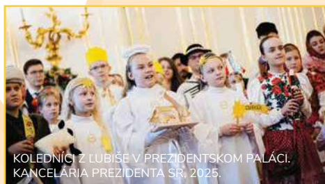
KOLEDNÍCI Z LUBIŠE V PREZIDENTSKOM PALÁCI. KANCELÁRIA PREZIDENTA SR, 2025.

Aj v 31. ročníku sa koledníci chystajú do Prezidentského paláca. Tisíce koledníkov budú tento rok zastupovať skupinky z Novej Bane za Banskobystrickú diecézu, za Spišskú diecézu Beňadovo (farnosť Mútne) a za Trnavskú arcidiecézu Suchá nad Parnou. Sme presvedčení o tom, že radostná zvesť má zaznieť aj na tomto mieste.