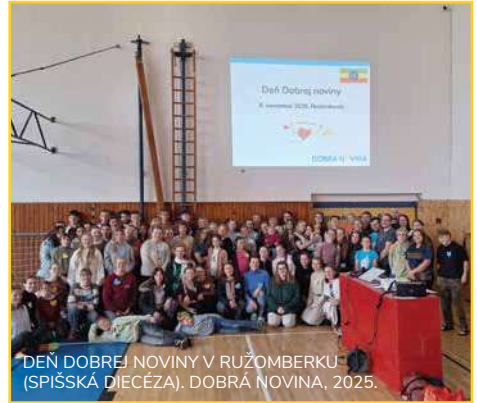
DEŇ DOBREJ NOVINY V RUŽOMBERKU (SPIŠSKÁ DIECÉZA), DOBRÁ NOVINA, 2025.

Chceme sa poďakovať za organizovanie Dňa Dobrej noviny. Stretlo sa 203 animátorov a koledníkov, aby načerpali nové inšpirácie a námety na prípravu aj samotné koledovanie. Nechýbala dobrá nálada, etiópska káva, Afroshop, zaujímavé aktivity a workshopy či vzácni hostia. V Ružomberku jedli africký obed holými rukami, vo Zvolene si zapakovali pravidlá verejnej zbierky pomocou kvízu, v Prešove hľadali srdiečka a v Nitre sa na chvíľu účastníci premenili na pacientov, pretože si vyskúšali, aké je to podať prvú po-