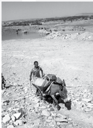
Žiaci vypomáhajú s nosením vody pre svoje rodiny. Kvalita takejto povrchovej vody je však často nevhodná, priam až zdraviu škodlivá.

So Spoločnosťou dcér kresťanskej lásky sv. Vincenta de Paul, tzv. vincentkami, spolupracujeme od roku 2011. Sestry vincentky pôsobia na severe Etiópie v regióne Tigray v štyroch komunitách – v Mekelle 2, v Alitene 1 a v Maichew 1. Viac ako 95 % základných škôl v oblasti Tigray nemá prístup k nezávadnej pitnej vode. Chýbajúci alebo nekvalitný zdroj pitnej vody v kombinácii s nedostatočnými hygienickými zariadeniami a slabé povedomie žiakov o základnej hygiene, ktoré vyústia do rôznych chorôb, majú za následok časté absencie na vyučovaní. V suchom a kamenistom regióne je väčšina obyvateľstva odkázaná na potravinovú pomoc centrálnej vlády či zahraničných partnerov. Vďaka výživovým programom sa vracajú deti naspäť do škôl, kde však chýba potrebná infraštruktúra. K tomuto úsiliu sa pripája aj Dobrá novina, ktorá podporí vyvrtanie studní, výstavbu umyvárok, nádrží na pitnú vodu a toaliet na dvoch vidieckych školách v Habes a Tsigereda.