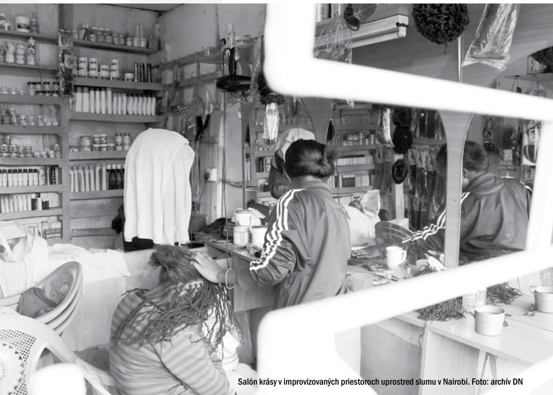
Salón krásy v improvizovaných priestoroch uprostred slumu v Nairobi.

lovica z nich nemá stabilnú prácu. Na živobytie si zarábajú cez príležitostné drobné práce či brigády. Prekážkou pre lepšie uplatnenie sa na pracovnom trhu je aj nízka úroveň vzdelania. V pilotnej fáze spolupráce podporuje Dobrá novina technické vzdelávanie pre 100 mladých ľudí, ktorí budú pokračovať na vopred dohodnutých stážach vo firmách a inštitúciách. MYSA sa okrem športu venuje aj umeniu, kultúre, právam detí, preventívnemu systému, komunitným knižniciam či ochrane životného prostredia.