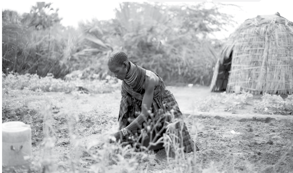
Skúsení vodní technici už roky nielen sprístupňujú čistú vodu ľuďom v dedinách a ich zvieratám, ale najnovšie hľadajú plytké studne a inštalujú solárne čerpacie systémy v povodí rieky Turkwel. Turkanci sa tak môžu venovať pestovaniu rozličných plodín aj v období sucha. Foto: Viktor Cicko, 2019

Dobrá novina spolupracuje s Katolíckou diecézou Lodwar od roku 1999. Odvtedy sme podporili mnohé projekty rozličného zamerania. Najdlhšie sa angažujeme v podpore vodného projektu, vzdelávania dospelých, detí s postihnutím v Centra Jána Pavla II. v Lokichare a v podpore sociálneho programu.