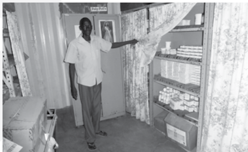
Jednoduchý sklad liekov. So zabezpečením spoľahlivej dodávky elektrickej energie budú môcť uschovávať lieky v ideálnej teplote. Foto: Norbert Demmelbauer, 2019

Doterajšia spolupráca Dobrej noviny s juhosudánskou organizáciou AAA sa zameriavala predovšetkým na Nemocnicu sv. Františka z Assisi v Maria Lou. Jej menšou sestrou je Klinika sv. Daniela Comboniho, ktorá sa špecializuje práve na toto špecifické ochorenie. Spádovú oblasť predstavuje územie s populáciou 274-tisíc obyvateľov, kde je svojim zameraním jedinou. V uplynulom roku navštívilo kliniku 568 pacientov, z toho 102 s pozitívnym výsledkom na tuberkulózu. Pracovníci vyrazili do terénu vyše 721-krát, pričom sa stretli s vyše 36-tisícami členmi miestnych komún na osvetových a vzdelávacích stretnutiach. Navštevovali pacientov priamo u nich doma, kde si overili podmien-